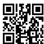
Ersatzhaltestelle Richtung Furth im Wald

Verlassen Sie den Bahnsteig und folgen Sie dem Fußweg ca. 240 m bis zur Raindorfer Straße. Biegen Sie nach links ab, überqueren Sie den Bahnübergang und begeben Sie sich an die Straße Kothmaißling (Cha55). Biegen Sie wieder nach links ab und folgen Sie dem Straßenverlauf bis zur jeweiligen Ersatzhaltestelle.