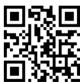
Ersatzhaltestelle Richtung Iserlohn