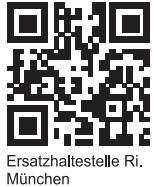
Ersatzhaltestelle Ri. München