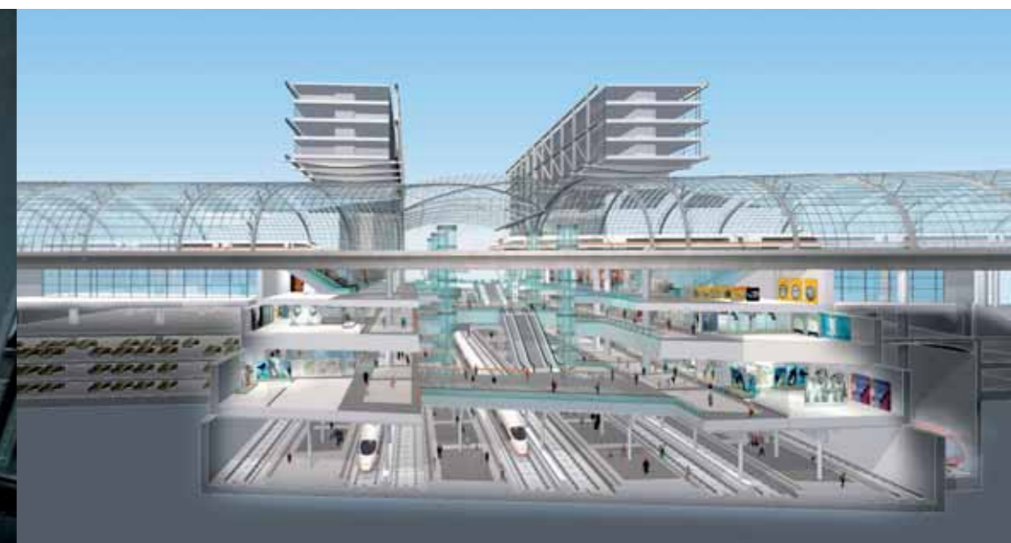
Spiel der Ebenen: Fünf Etagen lassen den Aufenthalt für jeden Reisenden zum Erlebnis werden.